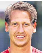
„Es freut mich, dass sich die Jungs belohnt haben.“