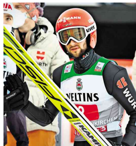
Markus Eisenbichler: Fragezeichen hinter der aktuellen Form.