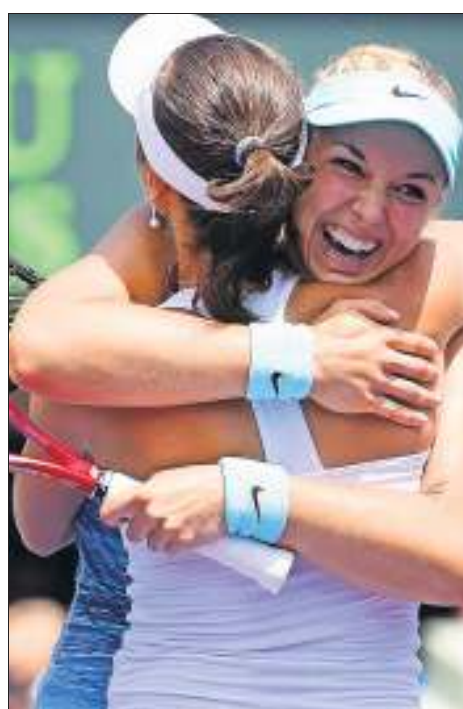
Glückliche Sieger: Sabine Lisicki und Martina Hingis (vo.) nach ihrem Coup von Miami

Seit Jahresbeginn wird sie von der ehemaligen Weltranglisten-Ersten betreut, die in