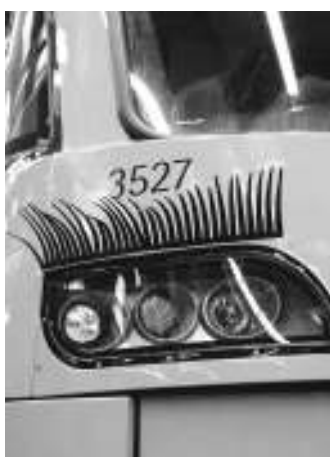
Sieht doch gleich noch besser aus.

Auch funktional erfreuen sich die neuen Flaggsschiffe der gelben Stuttgarter Bahnflotte eines guten Rufes, ob bei Kunden oder Fahrern. Dennoch wird den Betrachtern ab jetzt eine kleine, aber wohl doch etwas markante Ergänzung auffallen: die neuen