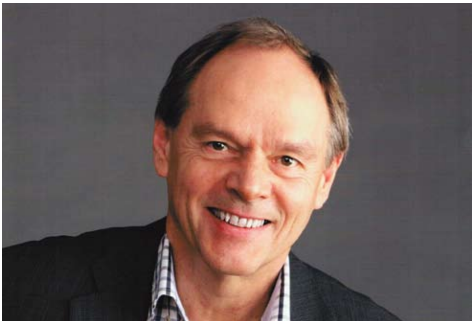
DTL-Präsident Manfred Kucht

Wettkampfformate für die Zuschauer und die Medien attraktiver zu gestalten.