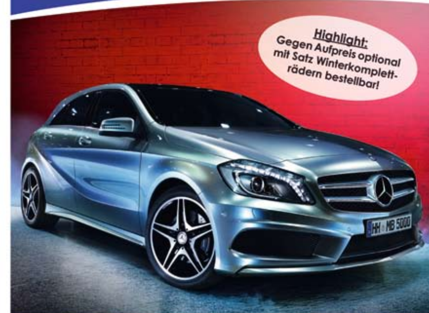
* Mercedes A180 5trg. BlueEFFICIENCY: Preis inkl. Überführungs- und Zulassungskosten, Kfz-Steuer, Kfz-Versicherung mit Selbstbehalt, gesetzl. MwSt., 15.000 km Jahresfreilaufleistung (Mehrkilometer gegen Aufpreis möglich). Sonderzahlungen fallen nicht an. Preis gilt für die Nutzergruppe 2. Stand: 12.07.13