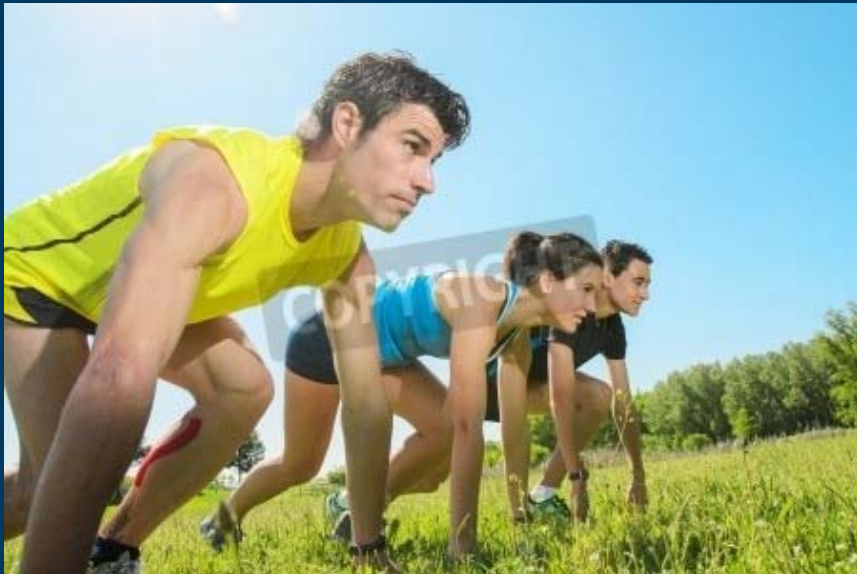
Perspektive: von unten